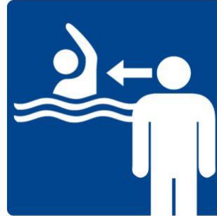
Kinder unter Aufsicht der Begleitperson