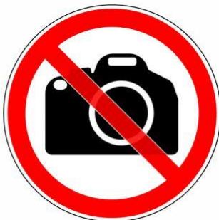
Fotografieren und Filmen verboten