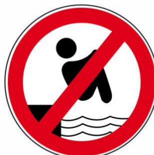
Nicht vom Rand springen