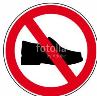
Keine Schuhe im Beckenbereich